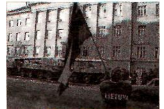
Prieš jėgą – jėga.