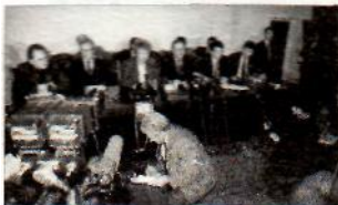
Spaudos konferencija Lietuvos atstovybėje Maskvoje.

V. ISAKOVAS. Lietuvos pozicija reiškia, kad viskas gali labai užsitęsti, kad Rusijos ir Lietuvos santykiai labai susikomplicuos. Kam mums to reikia? Sutikite su 1994 metais; kol nesutarsime, ekspertai negalės dirbti su tekstais.