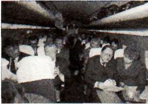
Derybų su TSRS delegacija pakeliui į Maskvą. 1990 m.