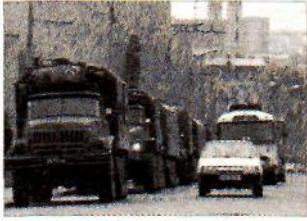
Išeina. 1993 m.