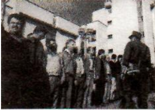
Savanoriai 1991 m. rugpjūtį.

pareiškimą, kuris bus pridėtas prie pagrindinės sutarties, nors mūsų derybų delegacijai tai buvo labai sunkus sprendimas.