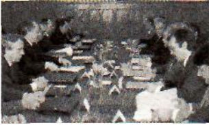
Pirmasis tarpvalstybinis Vytauto Landsbergio vadovaujamos delegacijos susitikimas su Nikolajaus Ryžkovo vadovaujama delegacija.