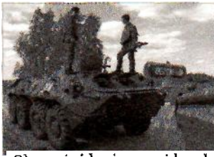
Okupacinė kariuomenė bando šeimininkauti.

Noriu išdėstyti Rusijos poziciją visais nurodytais klausimais.