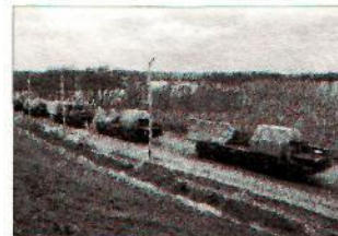
Namo, į Rytus.