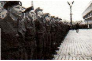
Lietuvos savanoriai 1990 m.