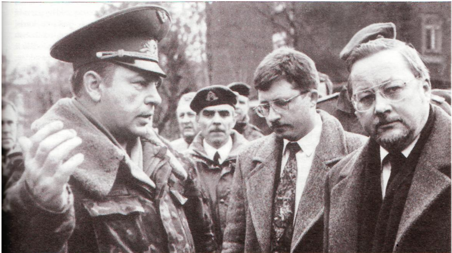
Rusams vis dar neišku, per kur išeiti. 1992 m.